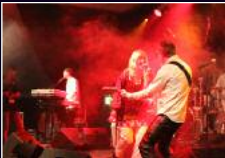
Eindrücke der Party 2010