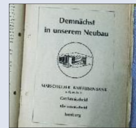
Anzeige Märscheider Raiffeisenbank e.G.m.b.H.