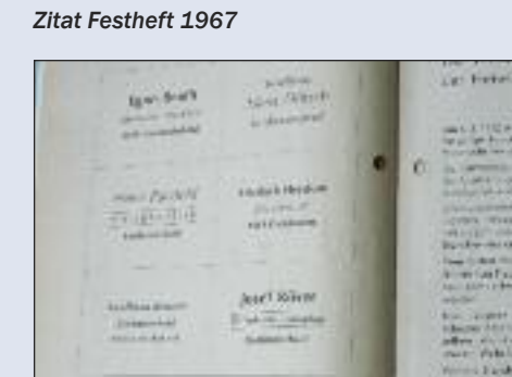
komplett ohne Schnickschnack

„... Da immer mehr Männer zum Kriegsdienst eingezogen wurden, mußte man ältere Männer zum Feuerwehrdienst verpflichten. Aber die Reihen lichtet sich derart, daß man gezwungen wurde, eine Frauenabteilung innerhalb der Wehr aufzustellen.“