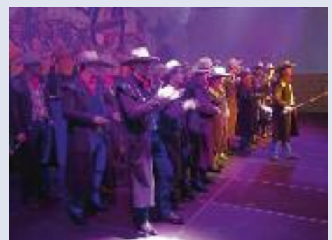
Kirmesmontag in unserer zweiten Heimat Gladbach 2015